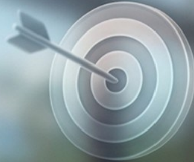
Target (Hasil Akhir)