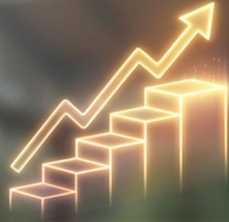
Sistem Harian (Atomic Habits)