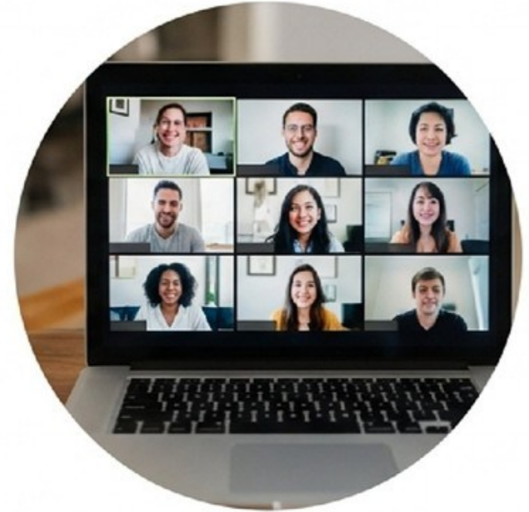
ONLINE / ZOOM

Script Latihan: “Boleh pinjam waktunya 30 menit? Saya ingin latihan bicara ke kamu dulu sebelum ke orang lain.”