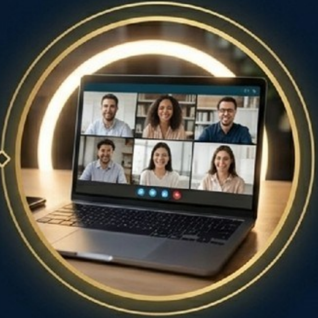
Online / Zoom

Jangan menunggu kondisi sempurna. Hujan? Macet? Gunakan Zoom. Tetangga kumpul? Gunakan Home Meeting.