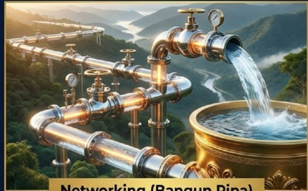
Networking (Bangun Pipa)