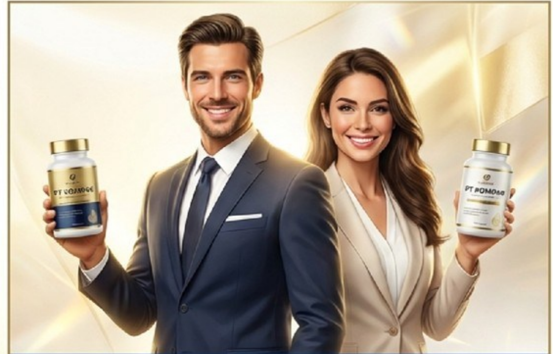
Leader PT Kompak = Produk PT Kompak

Bagaimana mungkin Anda berkoar-koar produk PT Kompak dahsyat, tapi di kamar mandi masih ada merek lain? Itu namanya tidak punya integritas! Jadilah Product of the Product.