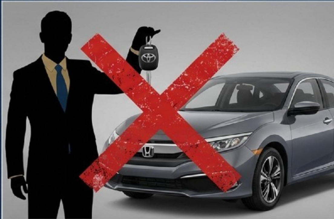
Sales Manager Toyota naik Honda?