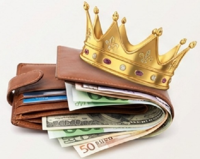
ISI DOMPET & KESUKSESAN