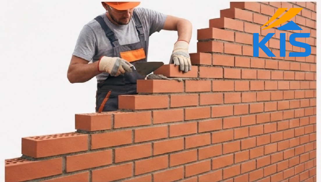
BATU BATA (Presisi, Standar, Kuat).

Anda ingin membangun Jaringan Raksasa. Anda butuh ' Batu Bata ' yang presisi. Mitra Bisnis Aktif ( MBA ) yang menonton video setiap hari memiliki pola pikir dan pengetahuan yang STANDAR . Jadilah Batu Bata untuk duplikasi yang sempurna.