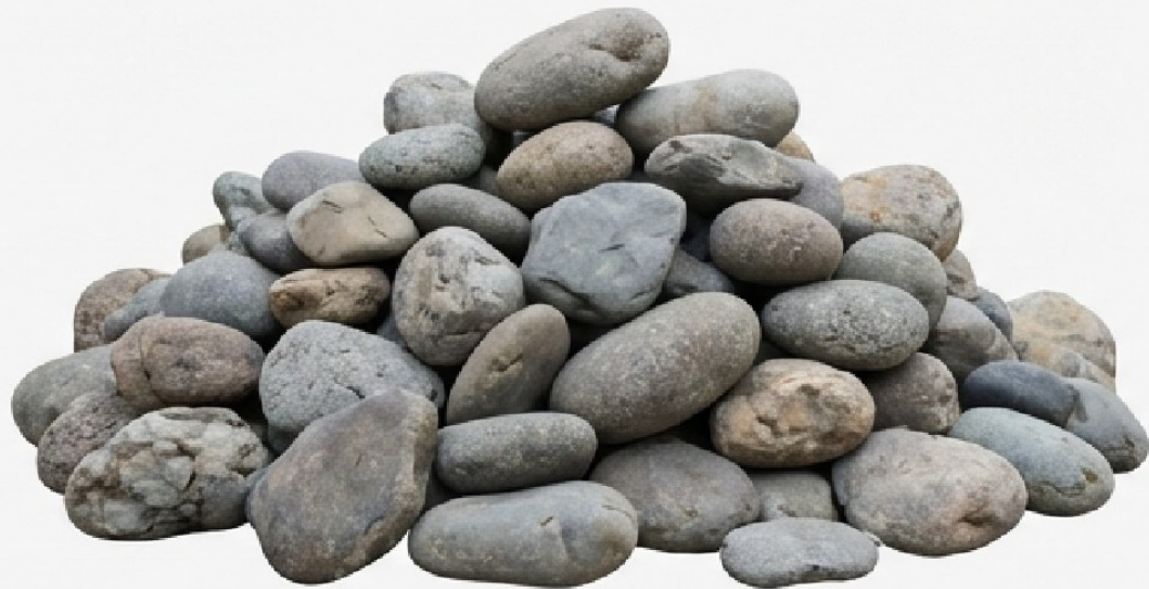
BATU KALI (Tidak Standar, Sulit Disusun Tinggi).