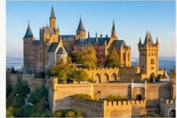
Jaringan Raksasa (Freedom)

Anda tidak bisa membangun istana (Jaringan Raksasa) tanpa batu bata yang kuat (Member Aktif).