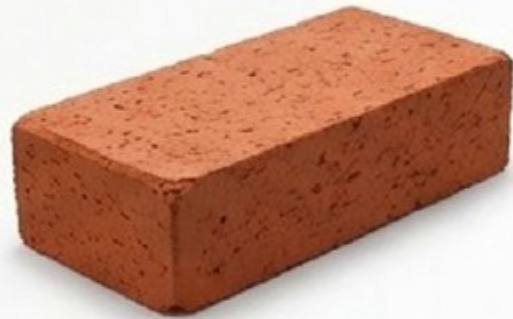
Member MBA (Batu Bata)