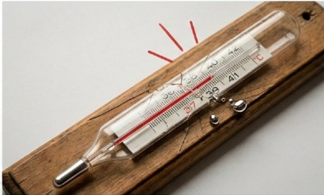
TERMOMETER (Labil / Pengikut)