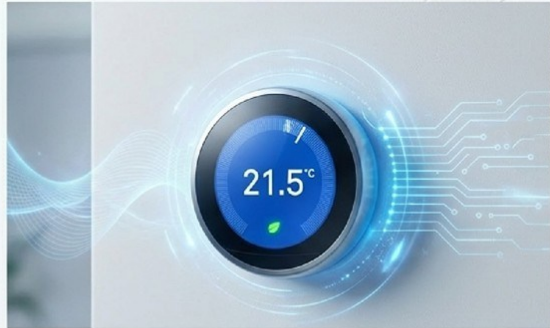
THERMOSTAT (Leader / Penentu Suhu)

Jangan biarkan prospek mengendalikan tombol emosi Anda. Andalah penentunya.